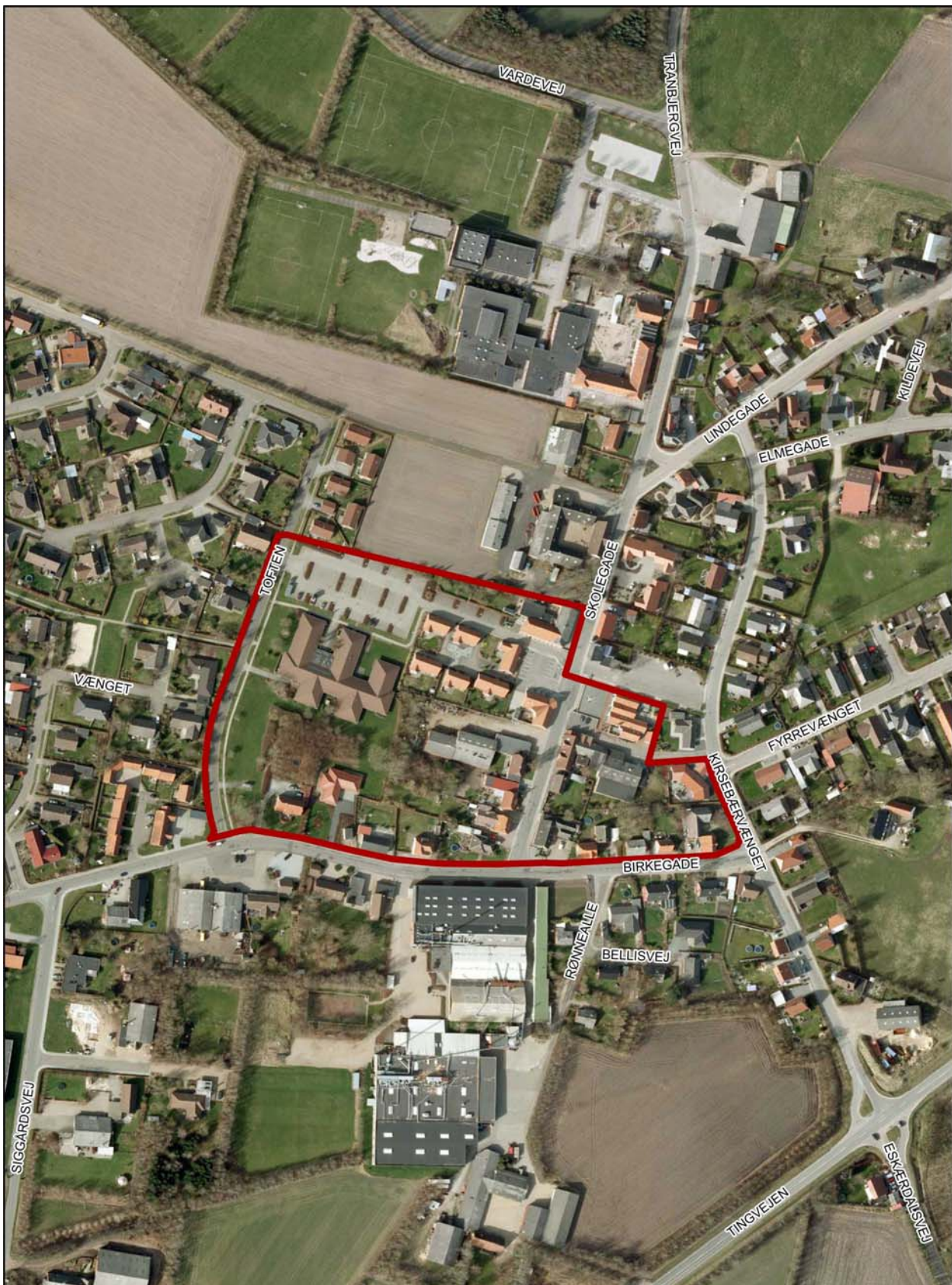
Området for Partiel Byplanvedtægt nr. 4 på baggrund af luftfoto.